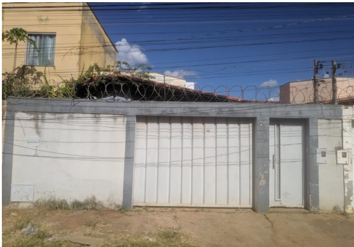
Vista frontal da fachada da casa de número 78.

Bem: Lote de terreno de nº 10 (dez), da quadra nº 15 (quinze), com matrícula 36688 e área de 300 m 2 , situado no Bairro Barcelona Park, na cidade de Montes Claros/MG, com área construída de aproximadamente 130 m 2 (casa de nº. 78) Data do registro: 27/04/2023