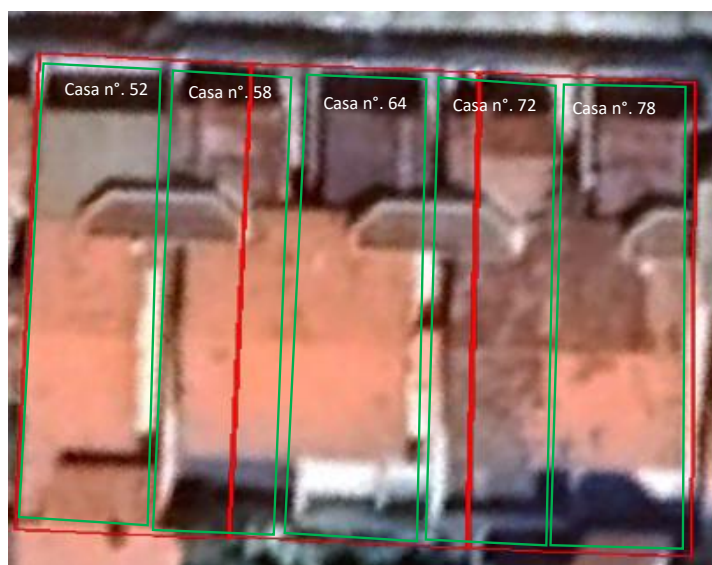
Destaque para o contorno aproximado dos três lotes indicados (em vermelho) e das cinco casas construídas sobre eles (em verde).