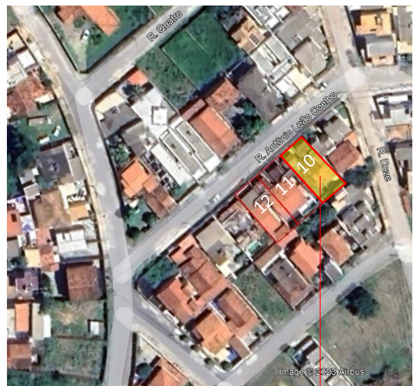
Comparativo entre a planta do bairro (Mapoteca da Prefeitura) e a visão aérea pelo Google Eart.

Parte da casa de nº. 72 (não levada em consideração na avaliação por invadir o lote vizinho de nº. 11