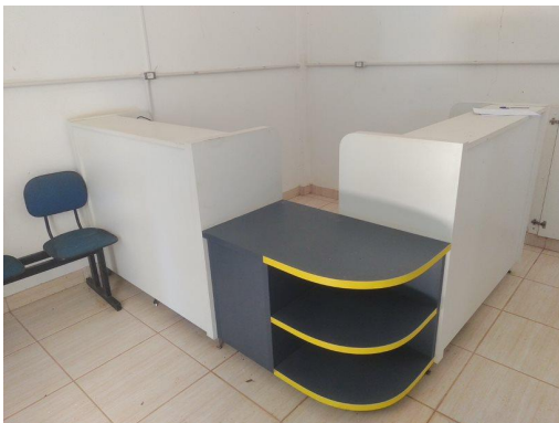
Item 3. Móvel recepção