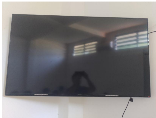
Item 2. Televisão