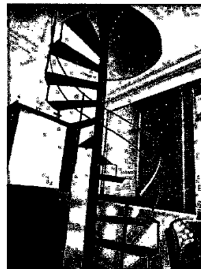
Imagem 4: escada de acesso ao 2º piso