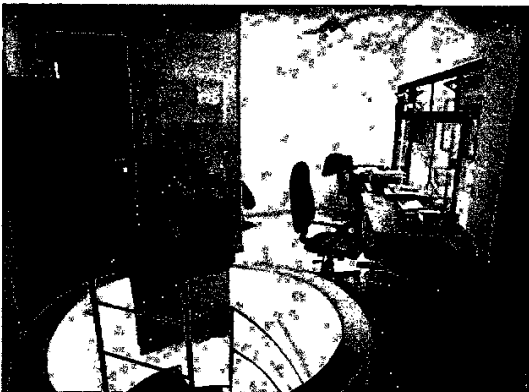
Imagem 5: sala no segundo piso