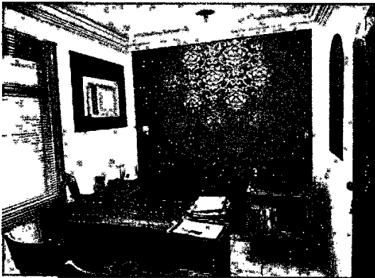
Imagem 3: sala principal